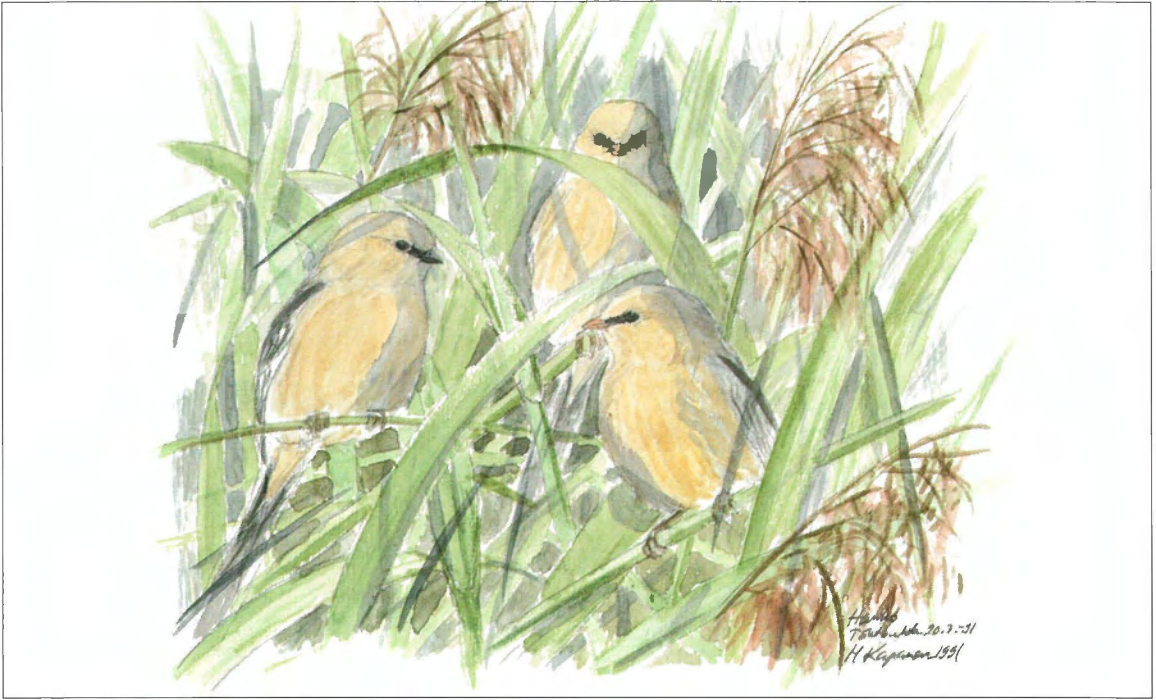
Viiksitimali ( Panurus biarmicus ) tavattiin Haliaksella syksyn aikana kahdesti. Nämä timalinuorukaiset varttuivat Hangon Täktbuktenin ruovikossa.

Nokkavarpusia muutti kevään aikana yhteensä 4 ja pohjansirkku havaittiin 8.5.