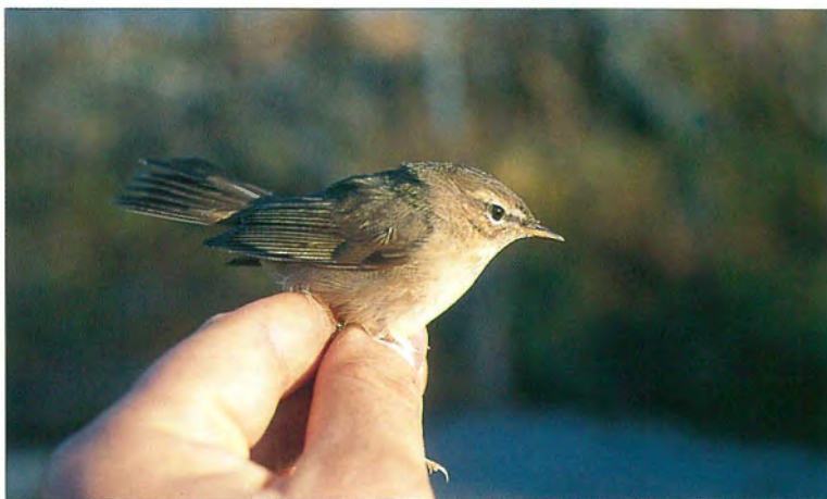
Haliaksella päästiin ihastelemaan ruskounilintua ( Phylloscopus fuscatus ).

Valkoselkätikkoja havaittiin syksyn aikana yhteensä hurjat 9 muuttavaa ja 5 paikallista. Niitä rengastettiin yhteensä 6, joista kolme 15.10. Rengastetuista linnuista 5 oli nuoria naaraita ja yksi nuori koiras. Ensimmäi-