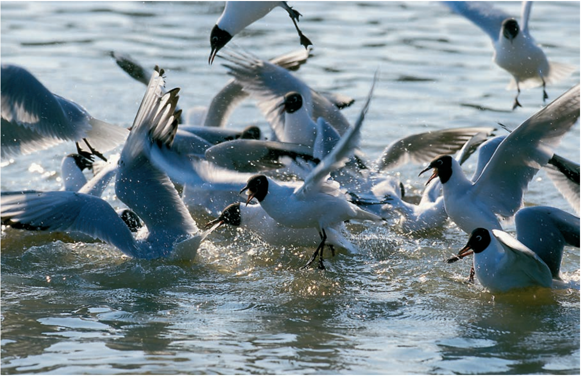
Aamupäivällä alkoi ridareita Larus ridibundus tulvia taivaan täydeltä. Loppusummaksi ynnättiin komeat 4895 muuttavaa. 8.4.2001.

lentäviin parviin. Kulorastaita nähtiin 1, laulurastaita vain 26!?, mustarastaita 10, räkättejä 3601 ja punakylkiä 35 724. Rastaat yhteensä peräti 51 177 yksilöä. Lienee yksi kovimmista rastasmuutoista Suomessa kautta aikojen. Rastaista 45 000 muutti kolmen tunnin aikana (=4yks./sek.). Bunkkerien viereisiin verkkoihin lennähti tuon tuostakin kymmenien yksilöiden rastasparvia, joskin suurin osa näistä ei jäänyt kiinni. Päivästä muodostui kuitenkin kevään toistaiseksi kovin rengastuspäivä (105 yks.).