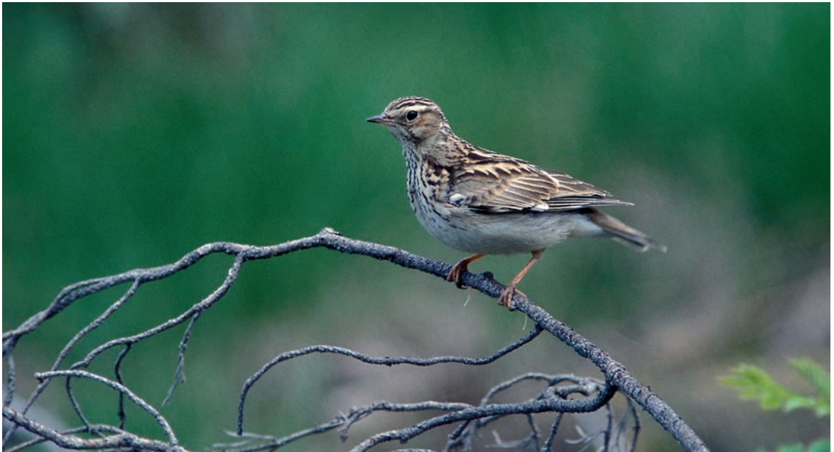
Monta, monta vuotta on yritetty revittää tuota legendaarista kangaskiurulukua Lullula arborea 123 vuodelta yks ja kaks paremmaksi. Ja nyt se onnistui, loppusumma huikaa 166 muuttavaa. © Antti Below, Dragsfjärd, kesäkuu 2001.

Johan pomppas! Kaunis, heikkotuulinen päivä, päivällä kesäisen lämmintä. Vieno pohjoistuuli antoi heti