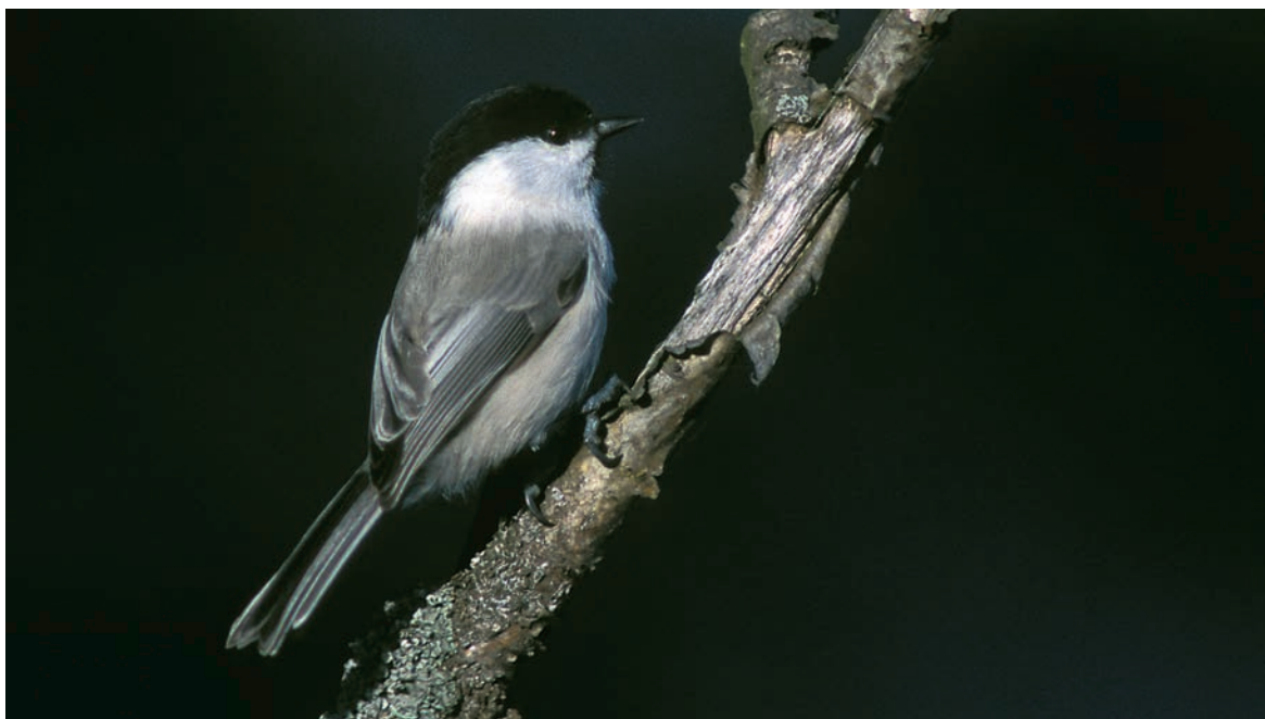
Tiaisten määrät ovat Haliaksella omaa luokkaansa. Kuvassa hömötiainen Parus montanus . © Pekka Komi, Kirkkonummi, lokakuu 2001.

Muuttokauden huipentuman, päämuuton tai massamuuton, ajoittuminen on tietenkin lajikohtaista ja monien lajien muuton huiput osataan ennakoida sääolojen mukaan. Esimerkiksi etelän ja lounaan välille kääntyvä tuuli noin 20. päivä toukokuuta povaa valkuposkihanhien muuttorynnistystä Suomenlahdella