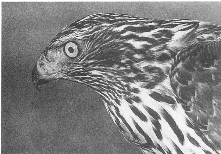
Tapporahan toivossa ammuttiin muitakin petolintuja kuin kuvan kanahaukkaa.

Vuonna 1923 metsästyslakia uudistettaessa korjattiin taas vahinkoeläinten luetteloa. Siihen kuuluivat nyt karhu, susi, ilves, ahma, hylje, maakotka, huuhkaja, kanahaukka ja varpushaukka. Tapporahoja lupasi valtio maksaa näistä vain sudesta ja ahmasta. Kunnat saivat huolehtia muiden petonisäkkäiden ja -lintujen tapporahoista. Samana vuonna 1923 annetun luonnon-suojelulain nojalla rauhoitettiin eli päästettiin tapporahaukasta lisäksi 9 haukka- ja 5 pöllölajia (mutta ei esim. maa- ja merikotkaa, kalasääksä ja muuttohaukkaa). Kiintoisaa on tarkastella surmatuista petolinnuista eri aikoina maksettujen tapporahojen määriä. Vuonna 1841 eri lajeista maksettiin niiden vahingollisuuden mukaan 6-20 äyriä, mikä vuonna 1937 vastasi suunnilleen 11-37 mk ja vuonna 1988 13-44 mk. Vuosisadan vaihteessa (v. 1898) tapporahojen arvot olivat aivan toista luokkaa vaihdellen 15 pennistä kahteen ja jopa viiteen markkaan. Vuonna 1937 nämä raha-arvot olivat vastaavasti 2,1, 28 ja 70 mk ja vuoden 1988 mukaan 2,7, 36 ja 90 mk. Olisi ollut ihme, elleivät tällaiset palkkiot olisi saaneet pyssymiehiä liikkeelle.