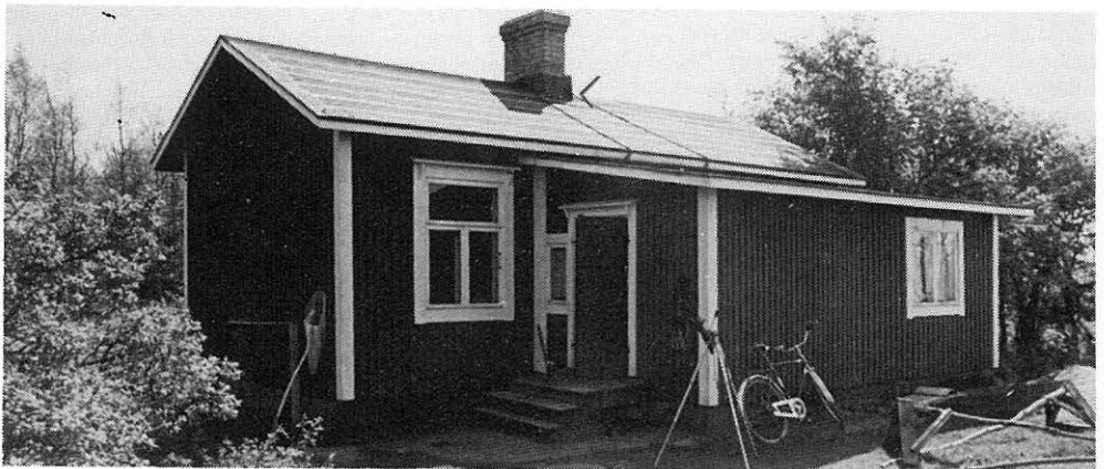
Hangon asemarakennus.

(22). Kovan petolintusyksyn näyttävin laji oli varpushaukka, jonka runsaus oli Haliaksen oloissa ennennäkemätöntä. Havaittuja kirjattiin peräti 5170, joista 137 rengastettiin. Edellisten syksyjen vastavat luvut ovat -81: 1791/36, -80: 1966/30 ja -79: 2664/31. Käyttöön otetut uudet petoverkot nostivat hieman viime syksyn rengastusmäärää, mutta muu-