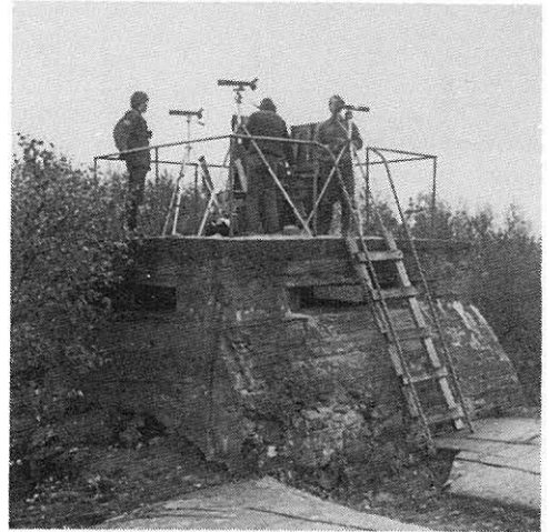
Uddskatanin bunkkeri on erinomainen stajauspaikka.

Koko vuoden rengastusmäärästä (6915 yksilöä 110 lajista) syksyn osuus oli 6575 yksilöä 101 lajista. Tehostettu katiskapyynti tuotti tuloksia. Rengastetuista 557 kahlaajasta (21 lajia) runsainpia olivat suosirri (348), tylli (67), isosirri (29) ja kuovisirri