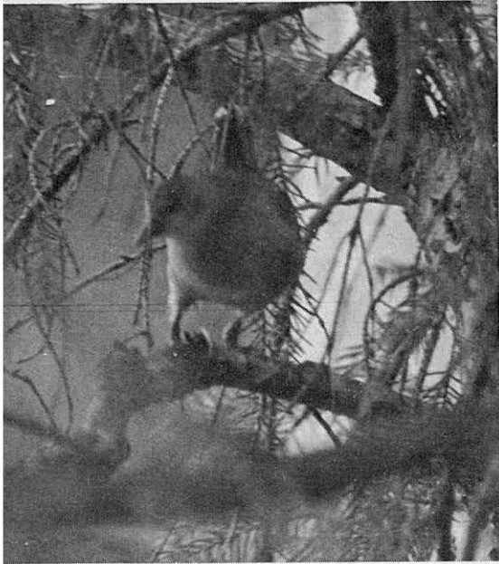
KUVA 7. Pikkukajava Parus parca , naaras, kuusamalaisessa kuusessa kesäkuussa 1976.