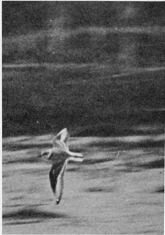
Kuva 3. Mustajalkatylli Charadrius alexandrinus , naaras, Hangossa. Pyrstössä on huomattavasti enemmän valkoista kuin tyllillä, ja siipijuova on voimakas.