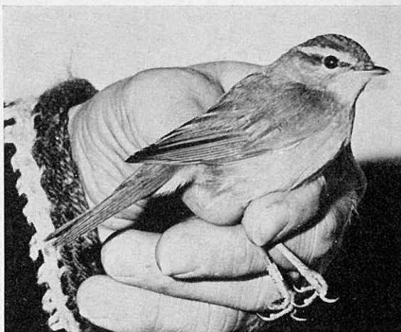
KUVA 5. Schwarzinuunilintu Phylloscopus schwarzi Säpissä. Voimakas nokka, suuri silmä ja leveä silmäkulmanjuova voidaan todeta mustavalkokuvastakin.

Lintu siirrettiin jatkuvan verkkoihin jäämisen takia läheiseen Mäkiluotoon. Toinen havainto Suomesta, ensimmäinen tavattiin joulukuussa 1968.