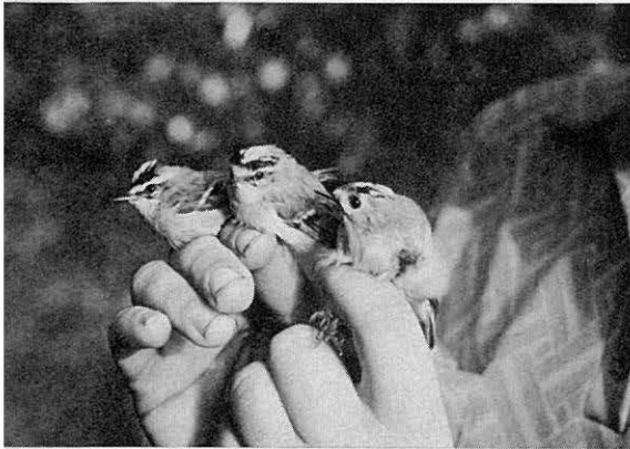
KUVA 6. Tulipäähippiäisiä Regulus ignicapillus hippiäisen seurassa Puolassa.

jotka ovat lähettäneet v. 1979 tai 1980 alussa ilmoituslomakkeen nokivarishavainnosta, toivotaan lähettävän uuden kadonneen tilalle.