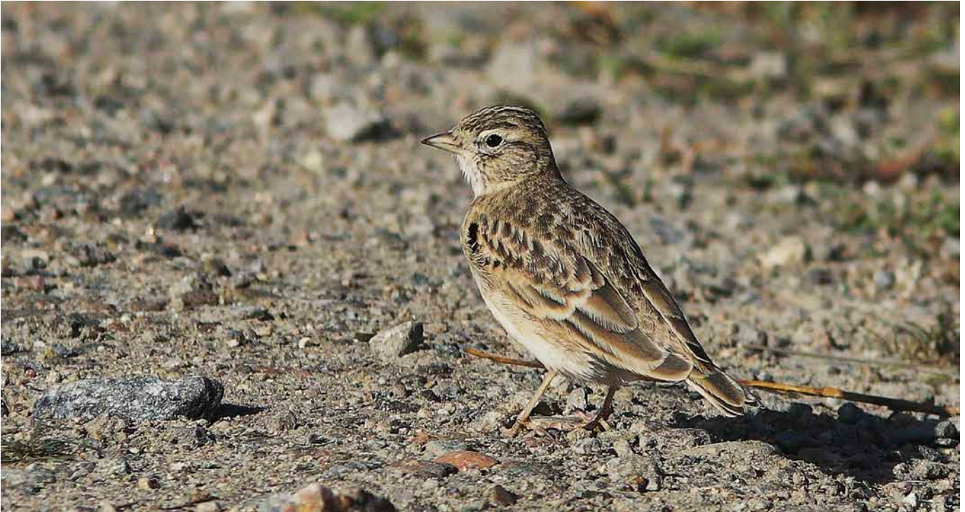
Lyhytvarvaskiuruja havaittiin runsaasti. Kuvassa Merikarvian lintu. A great number of Greater Short-toed Larks Calandrella brachydactyla was observed in 2017. The individual in the photo visited Merikarvia.