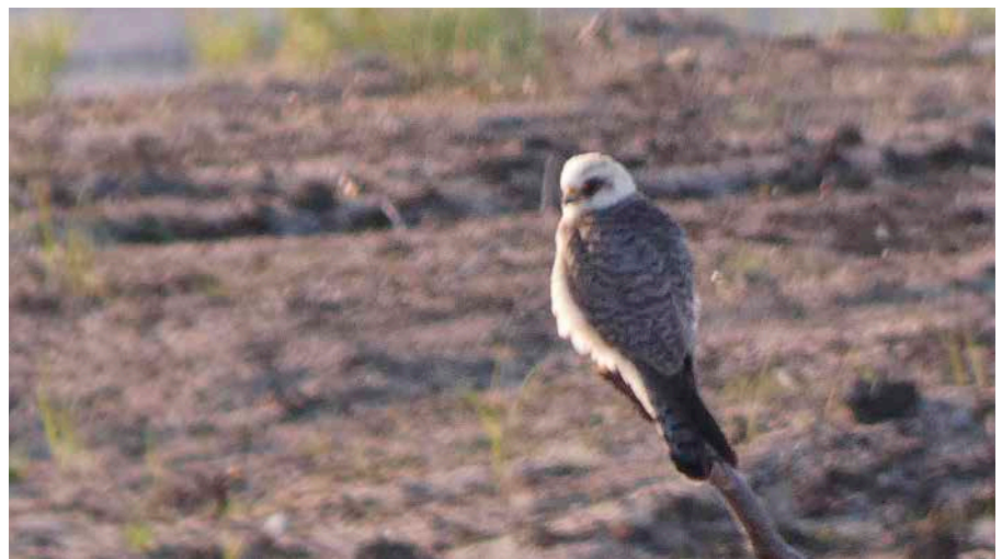
Punajalkahaukalla oli hiukan normaalia runsaampi esiintyminen. Keminmaalla havaittu naaras oli pohjoisin havainto vuodelta 2017. There were slightly more Red-footed Falcons Falco vespertinus than usually. The female observed in Keminmaa was the northernmost observation in 2017.