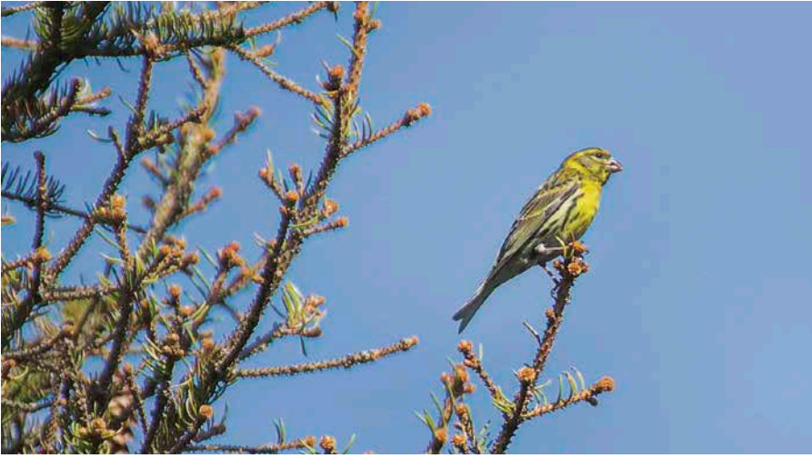
Keltahempolla oli varsin normaali esiintyminen. Rovaniemen lintu oli vuoden pohjoisin havainto. The abundance of the European Serin Serinus serinus was average. This individual, observed in Rovaniemi, was the northernmost observation of the species during 2017.