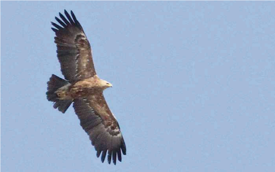
Pikkukiljukoitan esiintyminen oli verrattain vaatimatonta. Kuvassa Hailuodossa havaittu yksilö. Not many Lesser Spotted Eagles Aquila pomarina were seen in 2017. In the photo there is an individual observed in Hailuoto. JUHA MARKKOLA