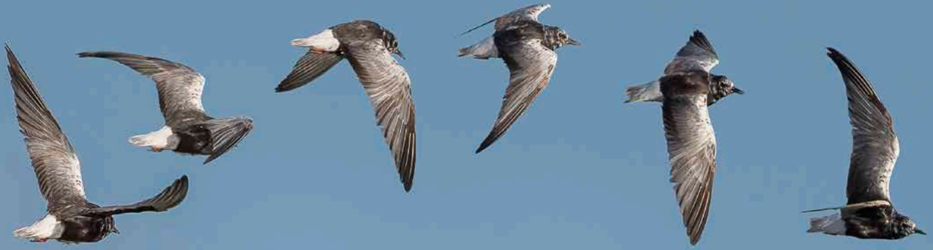
Keminmaan valkosiipitiiran lentorataa kuvamanipulaation avulla. The flight of the White-winged Black Tern Chlidonias leucopterus observed in Keminmaa is shown in the manipulated photo. KAI MARTTILA