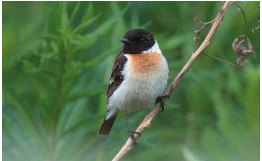
Sepeltaskuja havaittiin vain kaksi yksilöä. Ylöjärven lintu viihtyi pidempään paikalla. There were only two Eastern Stonechats Saxicola maura observed in 2017; the individual in Ylöjärvi had a longer stay than the other one. KARI KEKKI

Kolmas vuosi peräkkäin, kun havaintomäärät kasvavat – nyt voidaan puhua jo hyvästä vuodesta. Havainnot tehtiin yhtä lukuun ottamatta rannikolla ja suurin osa lokakuussa. Kaksi erikoista havaintoa: heinäkuussa löytyi Keminmaalta laulava lintu ja vuoden viimeisenä päivänä Espoosta alkavaa talvea uhmannut yksilö. Keväältä on aikaisemmin kaksi havaintoa, 11.5.1997 Rönnskäriltä ja 9.5.2014 Lågskäriltä, joten Keminmaan heinäkuinen lintu oli kautta aikain ensimmäinen Suomessa kesäkuukausina havaittu. Joulukuussa oli tehty ennen tätä vuotta kolme havaintoa, mutta Espoon linnusta tuli ensimmäinen vuodenvaihteen Suomessa viettänyt yksilö.