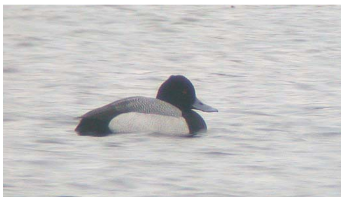
Pikkulapasotka ( Aythya affinis) koiras Kökarissa 24.3.2004. Uusi laji Suomelle! Lesser Scaup, new for Finland!

Katsauksessa on lajin nimen jälkeen kolme lukua. Ne ilmaisevat tavattujen yksilöiden kokonaismäärän tiettyinä ajanjaksoina: ensimmäinen luku käsittää ajan vuoteen 1974 asti, toinen luku jakson RK:n toiminnan alkamisesta 1975 vuoden 2003 loppuun ja kolmas esiteltävän vuoden 2004. Näiden lukujen summa on siis kaikkina aikoina tavattujen yksilöiden kokonaismäärä.