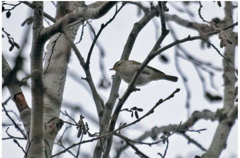
Amurinuunilintu ( Phylloscopus coronatus) Kokkolassa 23.10.2004. Uusi laji Suomelle! Eastern Crowned Warbler, new for Finland!