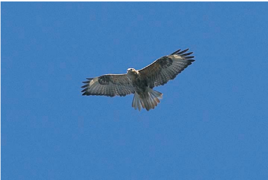
Arohiirihaukka ( Buteo rufinus ) Espoossa 26.9.2004.