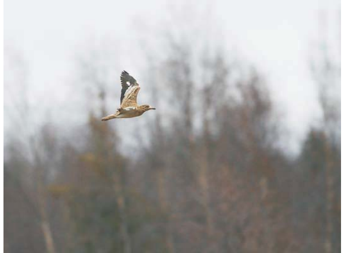
Paksujalka ( Burhinus oedicnemus) Kemissä 31.10.2004. Stone-curlew.