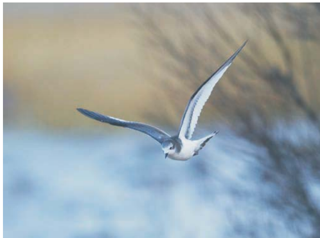
Tiiralokki ( Larus sabini) nuori Hailuodossa 14.11.2004. Sabine's Gull.