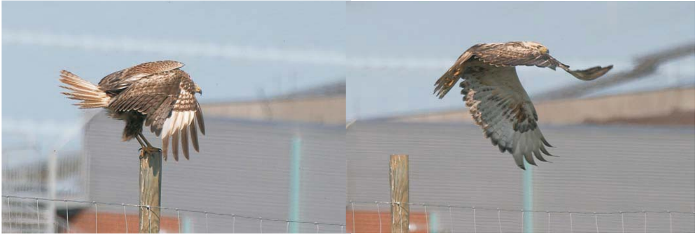
Arohiirihaukka ( Buteo rufinus) Espoon Ämmässuon kaatopaikalla 26.7.2004. Long-legged Buzzard.