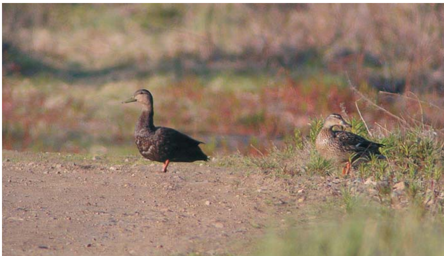
Nokisorsa ( Anas rubripes ) Sodankylässä 4.6.2004. Koiras viihtyi paikalla pitkään sinisorsanaaraan kanssa. Uusi laji Suomelle! Black Duck, new for Finland!.

Linnun tarkka ikä merkitään kalenterivuosiin: 1kv = samana kalenterivuonna syntynyt, 2kv = edellisenä kalenterivuonna