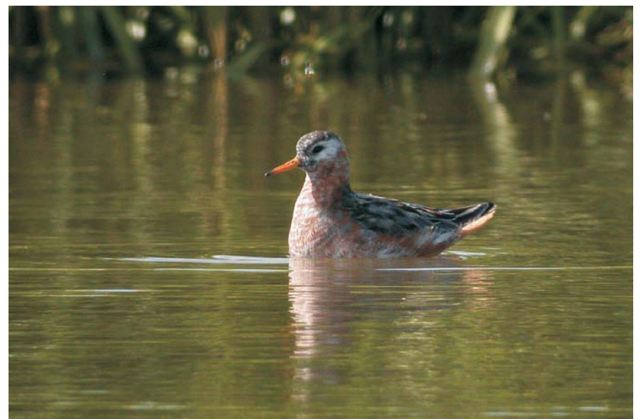
Isovesipääsky (Phalaropus fulicarius) naaras Lempäälässä 13.6.2004. Linnun päässä ja selkäpuolella on talvipuvun tyypisiä höyheniä, mutta mustan vähäinen määrä nokassa, mustapohjainen kurkku ja ruskean juovituksen puuttuminen pääläelta ovat naaraan tuntomerkkejä. Red Phalarope.

Lukumäärät sisältävät vain lajilleen määrittämättömät kurppelot.