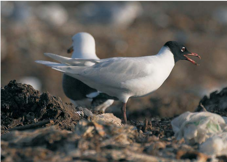
Mustanmerenlokki ( Larus melanocephalus) Tampereella 25.4.2004. Sama lintu vietti kesään- sä Ylöjärvellä kalalokkikoloniassa. Mediterranean Gull.

Isovesipääsky Phalaropus fulicarius (11,49,2)