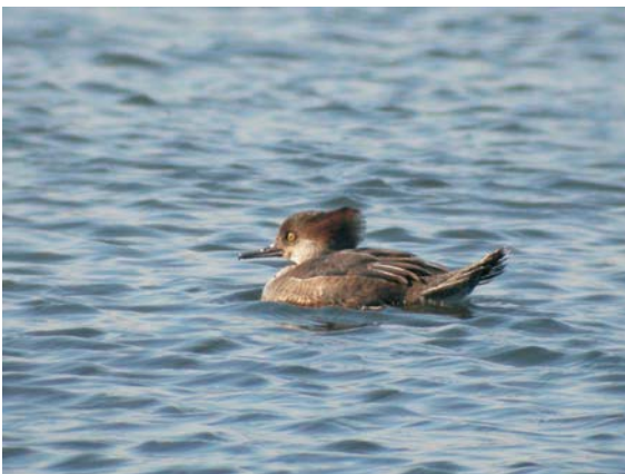
Harjakoskelo ( Mergus cucullatus) Espoossa 17.5.2004. Musta nokka ja pienet mustat täplät pään alaosassa viittaavat nuoreen koiraaseen. Hooded Merganser.