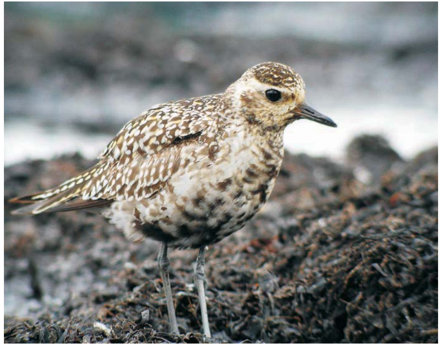
Siperiankurmitsa (Pluvialis fulva) vaihtopukuinen vanha lintu Kristiinankaupungissa 15.9.2004. Pacific Golden Plover.