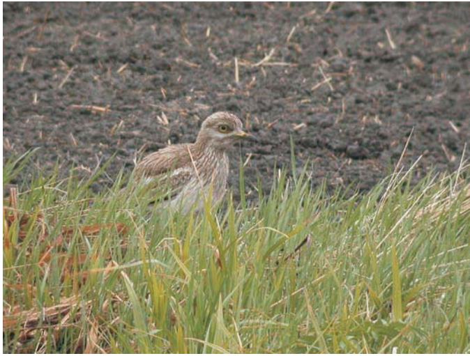
Paksujalka ( Burhinus oediconemus) Sipoossa 18.5.2004. Stone-curlew.