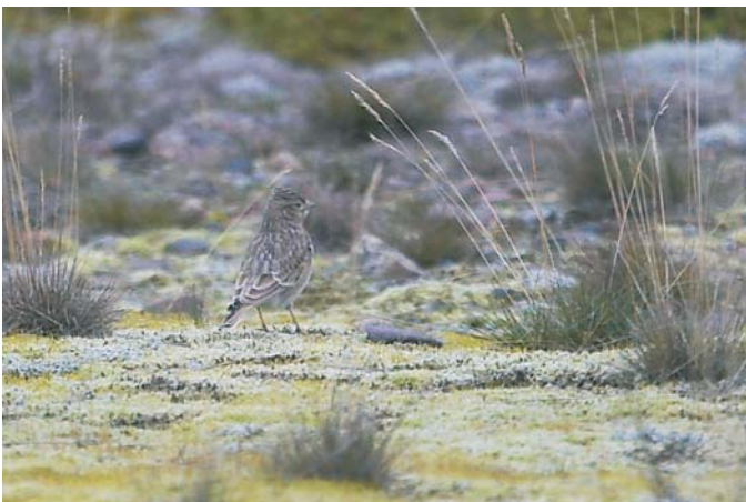
Pikkukiuuru ( Calandrella rufescens) Hailuodossa 26.9.2004. Lesser Short-toed Lark.