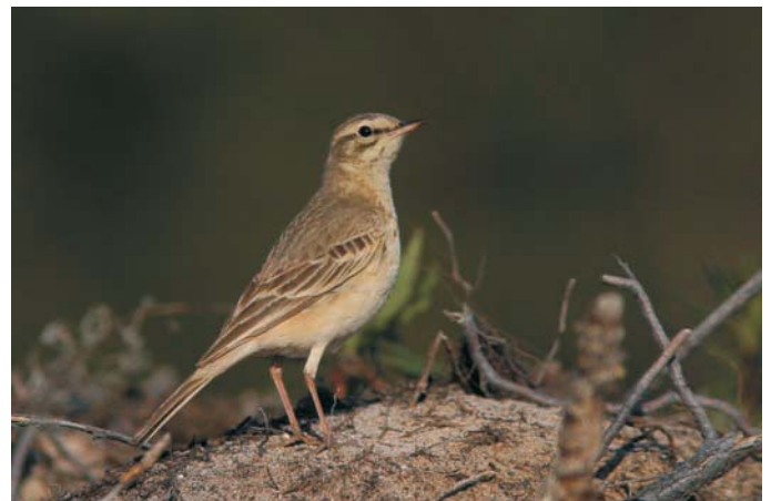
Nummikirvinen ( Anthus campestris ) Hangossa 3.6.2004. Tawny Pipit.