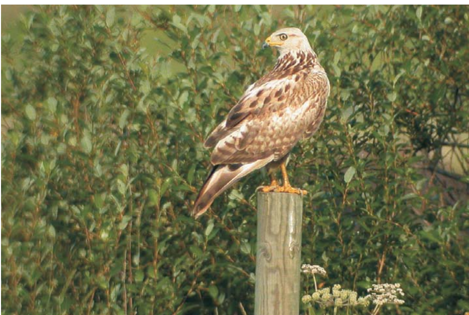
Arohiirihaukka ( Buteo rufinus ) Helsingissä 2.8.2004. Long-legged Buzzard.

Myös osa kynnärsulista ja pääosa pyrstöstä on vaihtunut. Linnut ovat eri yksilöitä, minkä näkee helpoiten sisimmistä käsisulista: heinäkuun linnun juovitus on kapeampaa ja esimerkiksi vasemman siiven toisessa käsisulassa sisältä laskien on näkyvissä neljä mustaa sisäjuovaa, kun syyskuun linnulla niitä on viisi.