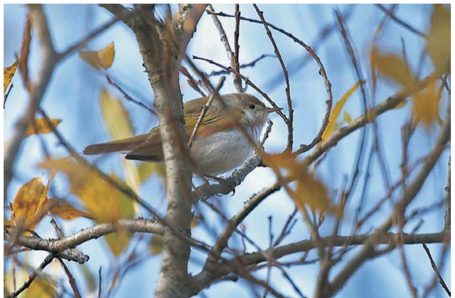
Balkaninuunilintu ( Phylloscopus orientalis) Siikajoella 9.10.2004. Laji muistuttaa suuresti vuoriuunilintua, mutta kutsuääni on erilainen. Eastern Bonelli's Warbler.