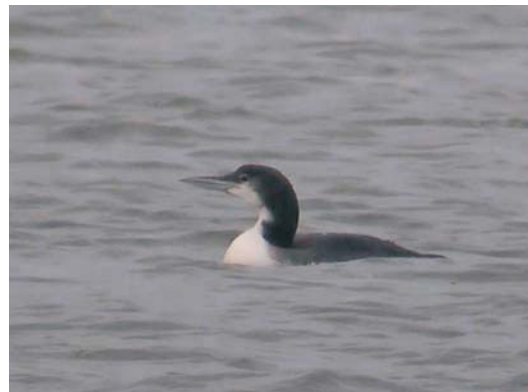
Amerikanjääkuikka ( Gavia immer) Kristiinankaupungissa 17.10.2004. Great Northern Diver.