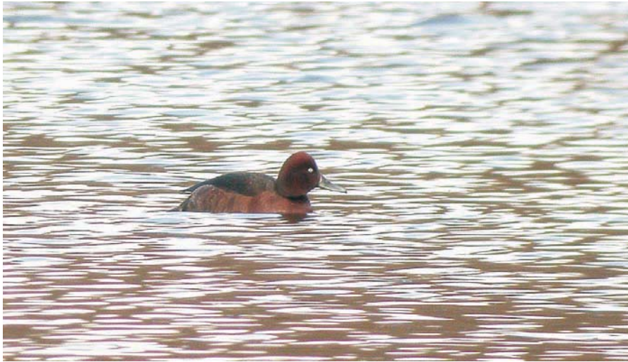
Ruskosotka ( Aythya nyroca) koiras Hämeenkyrössä 10.4.2004. Ferruginous Duck.

syntynyt, +1kv ennen kuluva kalenterivuotta syntynyt jne. Muut ikälyhenteet: juv = nuori lintu ensimmäisessä täydellisessä höyhenpuvussaan = nuoruuspukuinen, ad = aikuinen, subad = esiaikuinen, pull = pesä- tai maastopoikanen.