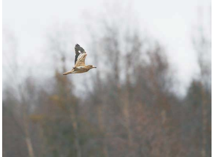
Paksujalka ( Burhinus oediconemus) Kemissä 31.10.2004. Stone-curlew.