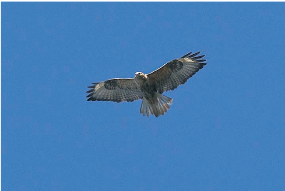
Arohiirihaukka ( Buteo rufinus ) Espoossa 26.9.2004.