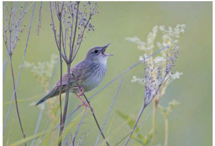
Viirosirkkalintu (Locustella lanceolata) Tyrnävällä 19.7.2004. Lanceolated Warbler.