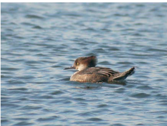
Harjakoskelo ( Mergus cucullatus) Espoossa 17.5.2004. Musta nokka ja pienet mustat täplät päällä alaosassa viittaavat nuoreen koiraaseen. Hooded Merganser.