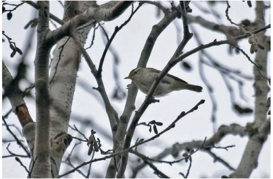
Amurinuunilintu ( Phylloscopus coronatus) Kokkolassa 23.10.2004. Uusi laji Suomelle! Eastern Crowned Warbler, new for Finland!