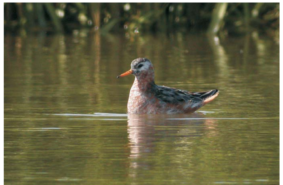
Isovesipääsky (Phalaropus fulicarius) naaras Lempäälässä 13.6.2004. Linnun päässä ja selkäpuolella on talvipuvun tyypisiä höyheniä, mutta mustan vähäinen määrä nokassa, musta-pohjainen kurkku ja ruskean juovituksen puuttuminen päältaelta ovat naaraan tuntomerkkejä. Red Phalarope.

Lukumäärät sisältävät vain lajilleen määrittämättömät kurppelot.