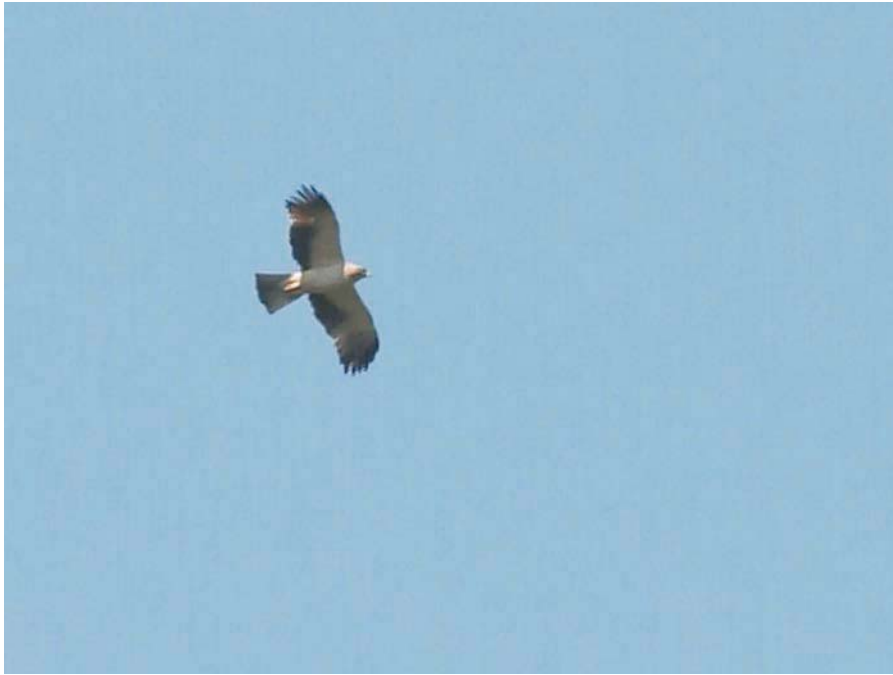
Pikkukotka ( Hieraetus pennatus ) Kirkkonummella 9.5.2004. Kuvaaja oli kuvaamassa kartta-perhosia, kun kotka suoritti ohilennon! Booted Eagle.

kesäkuu 2, heinäkuu 1 ja elokuu 1. Vuoden 2003 mennessä Ruotsissa on tavattu 6 pikkukorppikotkaa, joista 2 toukokuussa, 2 kesäkuussa ja 1 elokuussa. Näiden lisäksi vuonna 2000 nähtiin sama esiakuinen lintu touko-elokuussa usealla paikalla (Breife ym. 2003, Cederroth 2004).