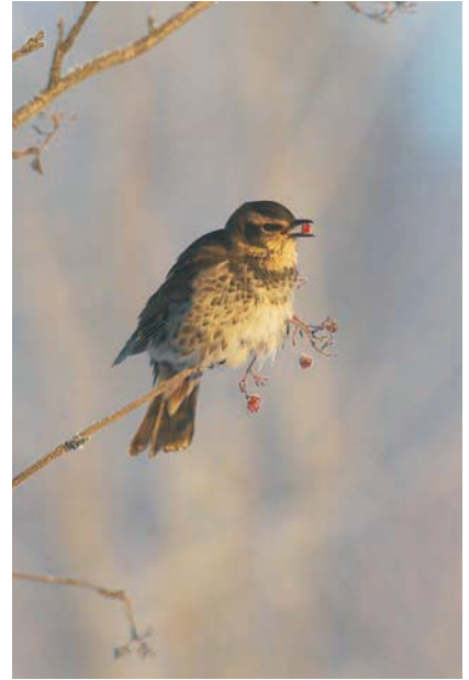
Ruosterastas (Turdus naumanni eunomus) Enontekiöllä 17.11.2004. Dusky Thrush.