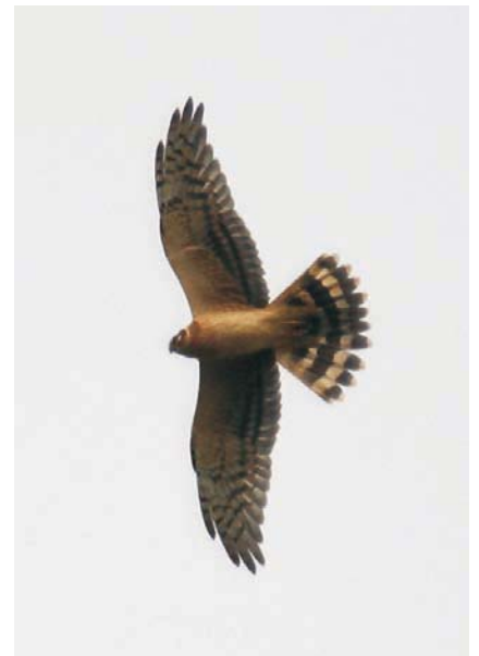
Arosuohaukka ( Circus macrourus ) nuori koiras Helsingissä 6.9.2004.

Edellinen havainto on vuodelta 1980 (touko-kesäkuussa sama lintu Värsilässä ja Ilomantsissa). Pesimäalueet ulottuvat Välimeren ympäristöstä itään Keski-Aasiaan ja Intiaan asti. Lisäksi laji pesii Afrikan pohjois- ja itäosissa. Suurin osa Euroopan pikkukorppikotkista pesii Espanjassa. Laji on vähentynyt suurimmassa osassa Eurooppaa (Forsman 1999). Suomen havainnot ajoittuvat seuraavasti: toukokuu 2,