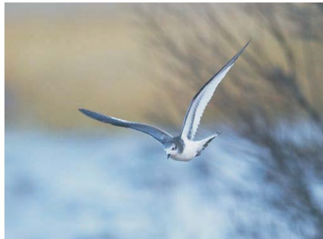
Tiiralokki ( Larus sabini) nuori Hailuodossa 14.11.2004. Sabine's Gull.