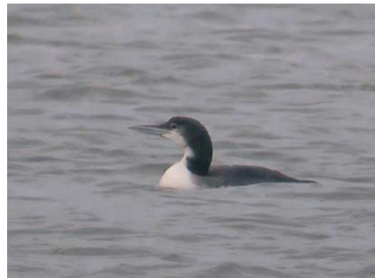
Amerikanjääkuikka ( Gavia immer) Kristiinankaupungissa 17.10.2004. Great Northern Diver.