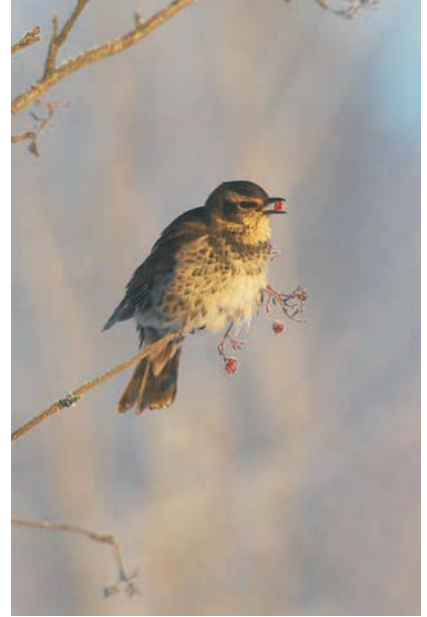
Ruosterastas (Turdus naumanni eunomus) Enontekiöllä 17.11.2004. Dusky Thrush.