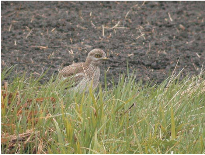
Paksujalka ( Burhinus oedicnemus) Sipoossa 18.5.2004. Stone-curlew.