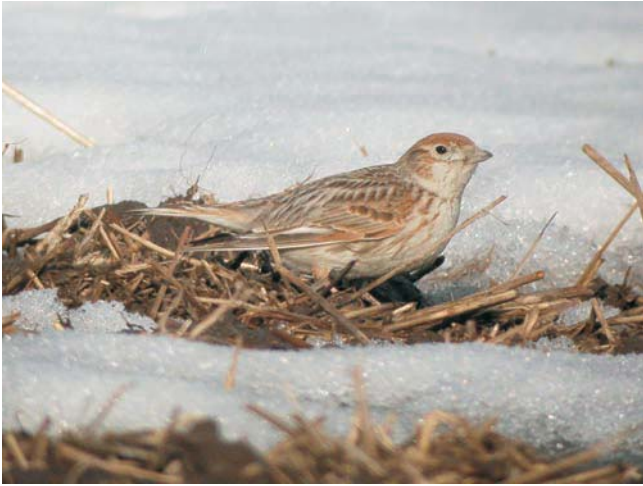
Valkosiipikiuru ( Melanocorypha leucoptera ) koiras Luumäellä 12.4.2004.