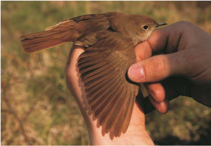
Etelänsatakieli (Luscinia megarhynchos) 2kv koiras Lemlandin Lågskärillä 7.5.2004. Common Nightingale.