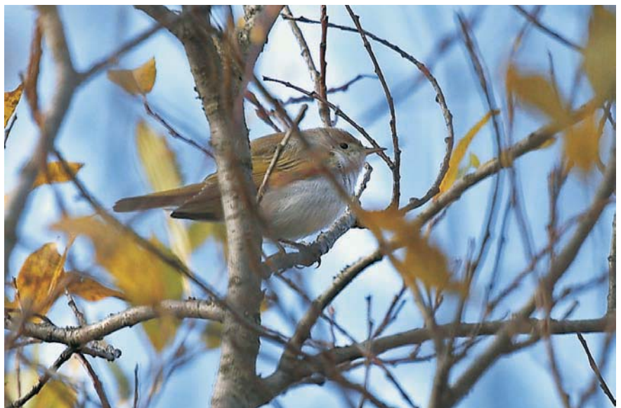
Balkaninuunilintu ( Phylloscopus orientalis) Siikajoella 9.10.2004. Laji muistuttaa suuresti vuoriuunilintua, mutta kutsuääni on erilainen. Eastern Bonelli's Warbler.