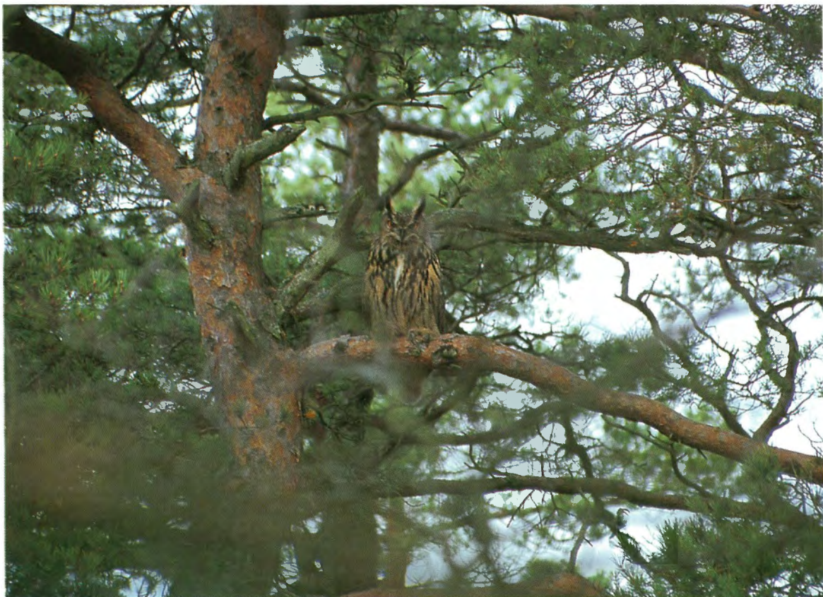
Huuhkaja Bubo bubo seikkaili aseman alueella syksyllä ja piti niemen jäniskantaa kauhun vallassa.