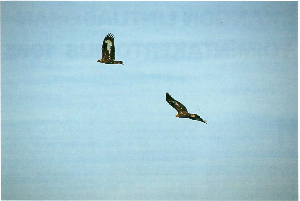
Maakotkia Aquila chrysaetos nähtiin syksyn aikana kohtalaisesti. Kuvassa kaksi nuorta lintua.

Kummelskäriin venähti tyylikkäästi 48 lajiin! Siitä on paha pistää paremmaksi.