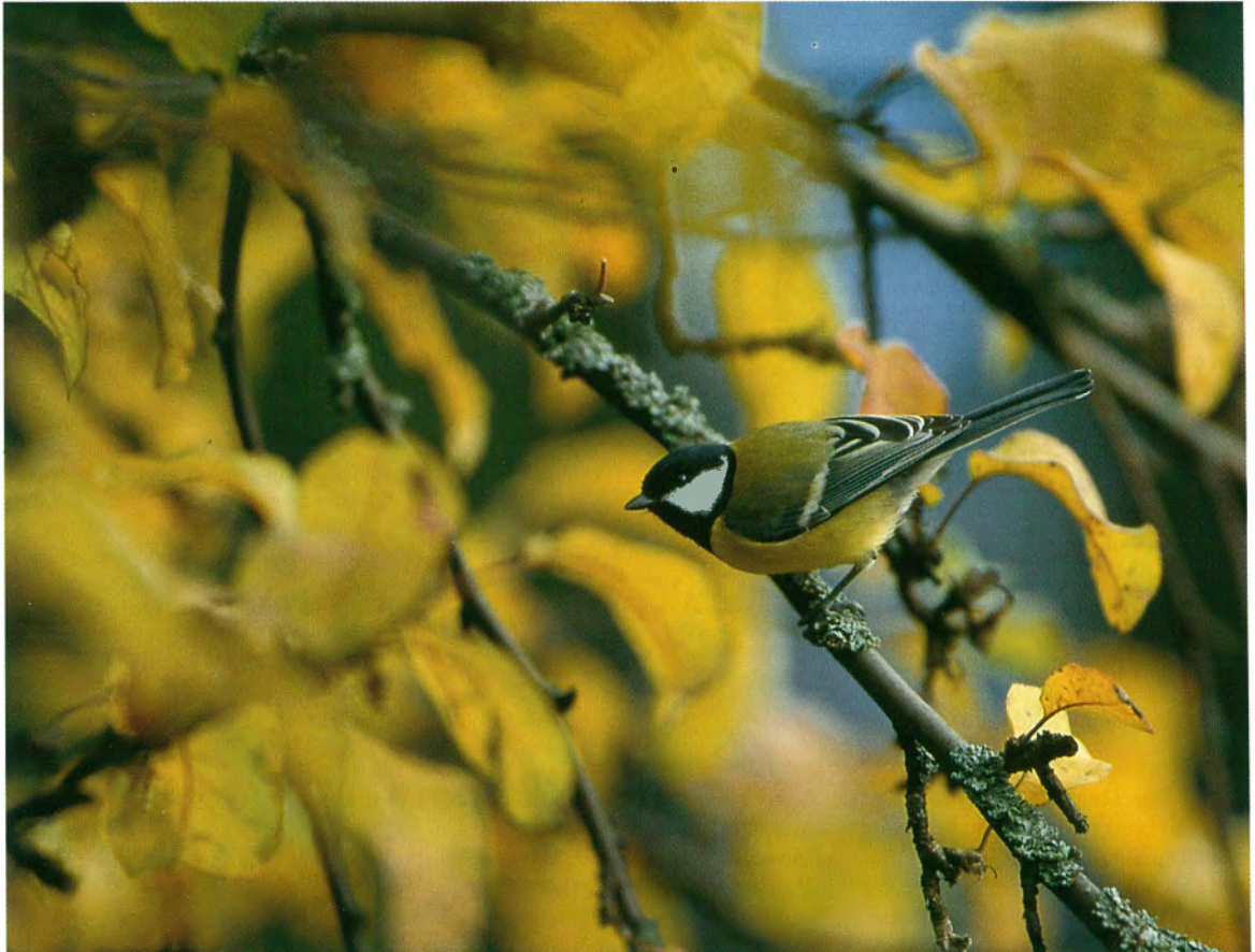
”Tuleekohan seuraava juttu minusta muuttolintujen erikoisnumeroon?”