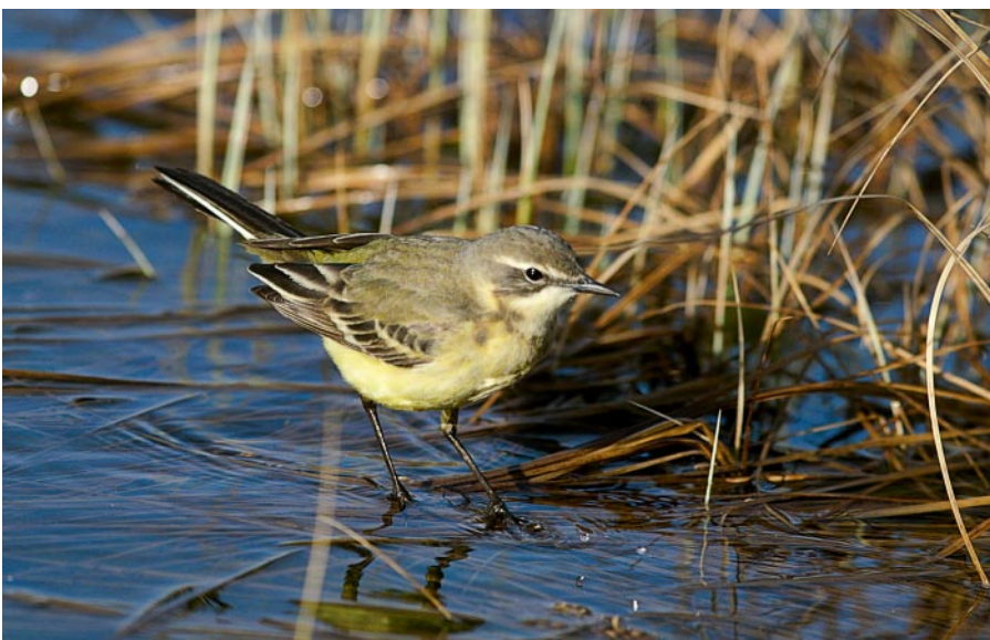
Keltävästäräkki Motacilla flava on ajautunut elinvoimaisesta vaarantuneeksi pitkään jatkuneen kannan taantumisen takia. Laji on lähes hävinnyt eteläisen Suomen maatalousympäristöistä ja soilta, mutta on edelleen yleinen ja runsaslukuinen pohjoisessa.