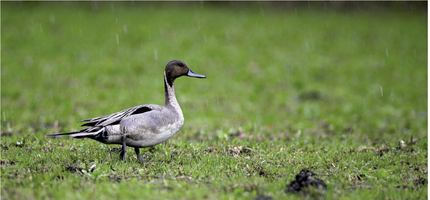
Nyt vaarantuneeksi katsottu jouhisorsa Anas acuta oli kolmen muun metsästettävän sorsan tavoin elinvoimainen vuoden 2000 arvioinnissa. Näiden neljän lajin kannat ovat vähentyneet yli 30 %:a kymmenen vuoden aikana. Syiksi arvellaan elinympäristömuutoksia ja metsästysverotusta pesimä- ja talvehtimisalueilla sekä muuttoreittien varrella. ANTTI BELOW

mille uhanalaisuusluokituksen muutoksille, jotka ovat seurausta kriteerien tai tulkinnan muutoksista (vaikutus näkyi vasta kolmannessa desimaalissa). Putkilokasvien (n = 628) vastaavat luvut olivat 0,82 ja 0,80 (Juslén 2010). Siten lintujen ja putkilokasvien uhanalaistumiskehitys on ollut samansuuntaista viimeisen vuosikymmenen aikana, mutta putkilokasvien keskimääräinen häviämiskasvu on hieman suurempi kuin lintujen. Analyysi osoittaa, että ainakaan näillä lajiryhmillä monimuotoisuuden vähenemiseen johtava uhanalaistumiskehitys ei ole pysähtynyt. Koko Punaisessa kirjassa arvioidun lajiston (n = 20 888) RLI = 0,91 vuonna 2010 (Juslén 2010) eli lintujen keskimääräinen häviämiskasvu on suurempi kuin koko lajiston.