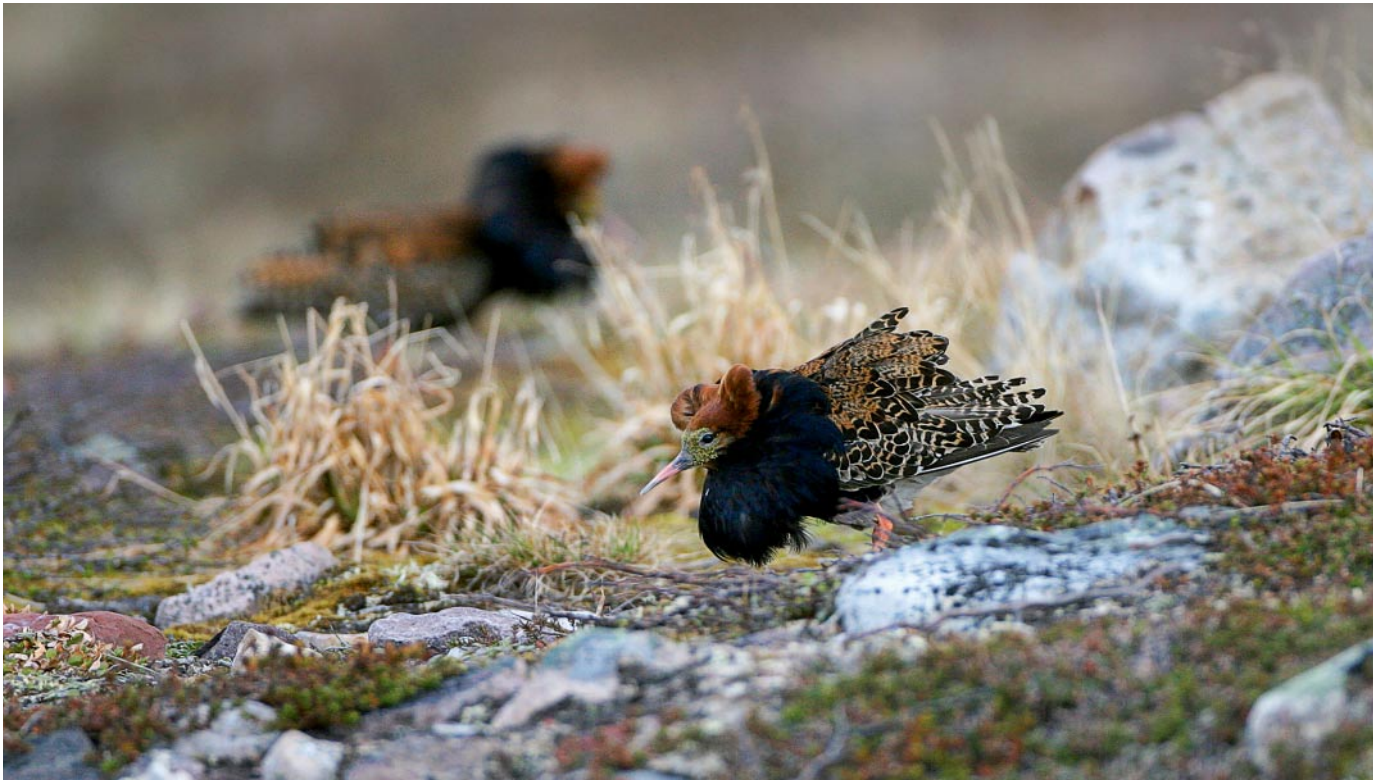
Suokukko Philomachus pugnax romahti silmälläpidettävästä erittäin uhanalaiseksi kymmenessä vuodessa. Näin nopeasti tapahtuneen voimakkaan uhanalaistumisen syy ei ole tiedossa, mutta se saattaa liittyä koko läntisen pesimäkannan laajamittaiseen siirtymiseen pesimään aiempaa idempänä. ANTTI BELOW