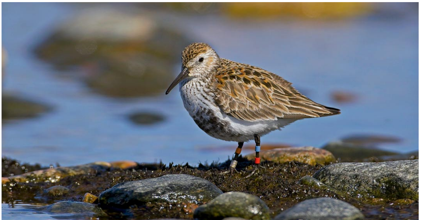
Äärimmäisen uhanalaisen etelänsuosirrin Calidris alpina schinzii pesimäpaikkojen umpeenkasvu on estettävä lajin kannan säilyttämiseksi rannikoillamme. Tämä Utössä huhtikuussa 2011 kuvattu yksilö on pesinyt Lumijoella.