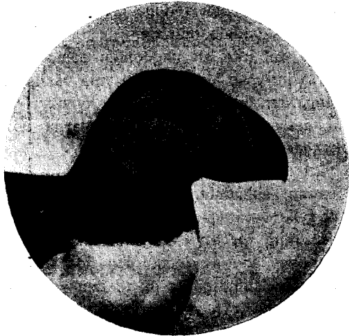
Fratercula arctica Heinäsaaren yleisin lintu.

63. Alca torda L. — Joku määrä pesii kivikkoihin.