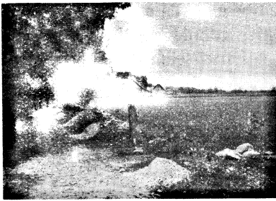
Fig. 1. Der typische Lebensraum des Ortolans in Valkla.