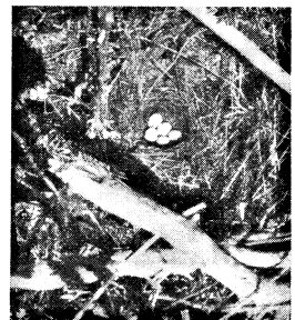
Fig. 4. Das Ortolan-Nest in Rannamöisa in Kiesgrube.