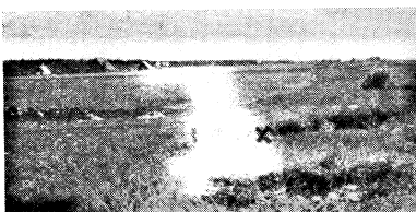
Fig. 3. Der Nistraum des Ortolans in Rannamöisa. Der Neststandort mit einem X gekennzeichnet.

Die Nestfunde in Kunda und Rannamöisa, welche zugleich die Erstfunde in Eesti sind, stammen aus augenfällig ähnlichen Biotopen. In Kunda (Fig. 2) bilden zwischen den Feldern gelegene unbeackerte dürre Moränanhöhen, die mit Alvarvegetation