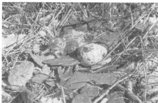
Kuva 1. Rantakurvin, Xenus cinerea , pesä Laajan saarella Oulun edustalla 9. VII 1957. Kaksi vanhempaa poikasta jo lähtenyt pesästä.

Löydettäessä, siis 8. VII, pesässä oli kaksi munaa ja kaksi poikasta. Seuraavana aamupäivänä kuoriutui kolmaskin poikanen ja