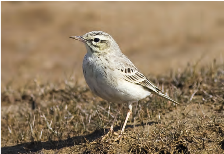
Aikuisen nummikirvisen vatsapuoli voi olla käytännössä täysin viiruton, mutta usein rinnan sivuilla on heikkoa lyhyttä viirutusta. Leukajuova on hyvin heikko toisin kuin muilla kirvisillä. Selvä musta ohjas on hyvä nummikirvisen tuntomerkki. Vaalea silmäkulmajuova on leveä. Huomaa myös pitkät ja vaaleat jalat. Pori 23.5.2009.