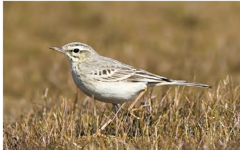
Nummikirvinen on hoikka ja pitkäpyrstöinen kookas kirvinen. Nokka on tukeva, takavarpaan kynsi ei ole yhtä pitkä kuin isokirvisellä. Yleisväritykseltään nummikirvinen on hyvin vaalea. Selässä ja hartiahöyhenissä ei ole välttämättä lainkaan tummia keskustoja, eli selkä voi näyttää täysin viiruttomalta. Siiven keskimmaisissa peitinhöyhenissä on tyypillisesti kontrastikkaat tummat keskustat ja leveät vaaleat kärjet. Pori 23.5.2009.

hieman isokirvistä pienempi. Se on hoikka, pitkäjalkainen ja pitkäpyrstöinen. Nokka on kookas mutta teräväkärkinen.