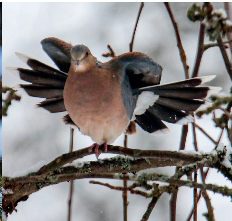
Tällä keväisellä idänturturikyhykällä hartiahöyhenten ja siiven peitinhöyhenten reunukset ovat leveästi oranssinruskeat ja näiden höyhenten kapealti tummat keskustat ovat kärkeänsänsä terävän kiilamaiset. Pyrstön alapeitinhöyhenet ja alaperä näyttävät lähes lumivalkoisilta, ja väri jatkuu valkeana pitkälle alavatsan keskusta. Myös pyrstösulkien kärjet ovat selvästi puhtaanvalkoiset, joten yksilö voidaan oleellisten tuntomerkkien perusteella määrittää meena-alalajin idänturturikyhykiksi. Turturikyhykystä linnun erottaa muun muassa harmaan otsan, pyöreän silmän ihopoimun ja vaaleareunaisten kyynärsulkien perusteella.

pyrstösulkien kärkien, alaperän ja alavatsan väritys sekä siiven peitinhöyhenten ja hartiahöyhenten kuviointi ja väritys. Nimialalaji orientalis on lisäksi keskimäärin suurempi kuin meena ja selkäpuolelta tummempi, mutta näiden tuntomerkkien käyttö ilman vertailukohtaa on vaikeaa.