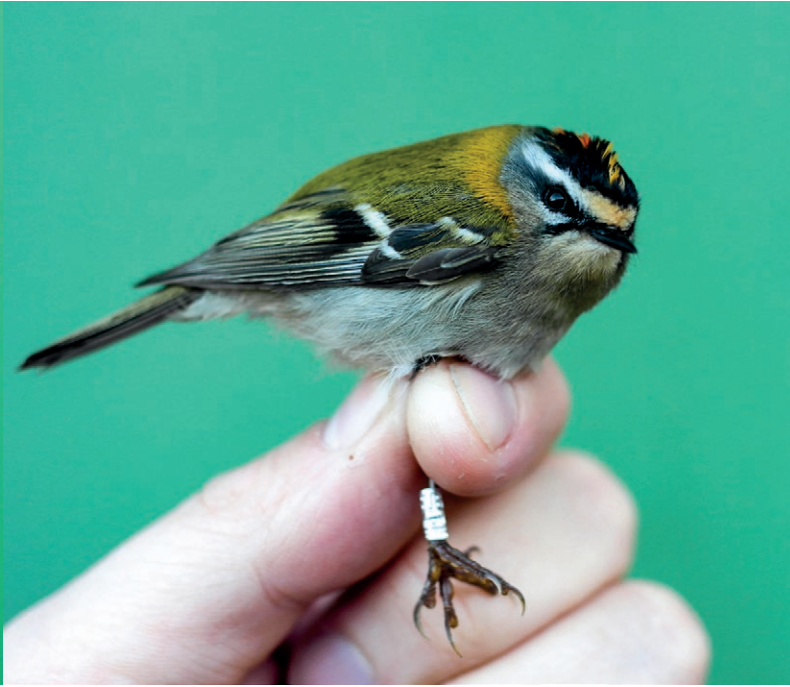
Kaikissa tilanteissa koiraan pääläen oranssi väri ei välttämättä näy kovin selvästi. Kuvassa on nuori (2kv) koiras. Ruotsi 20.4.2013.

S uomen ensimmäinen tulipäähippiäinen havaittiin Ahvenanmaalla, Lemlandin Lågskärin lintuasemalla 19.12.1968–7.1.1969. Varsin pitkään laji pysytteli suurharvinaisuutena: ennen 2000-lukua havaittiin yhteensä vain 14 yksilöä. Viime vuosina runsastuminen on ollut voimakasta: yli kaksi kolmasosaa havainnoista on 2010-luvulta.