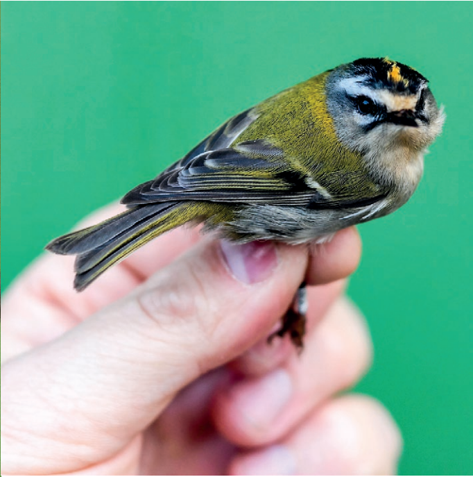
Tulipäähippiäisnaaraalla on usein hyvin selvästi oranssia väriä pääläella, toisin kuin hippiäisellä. Kuvassa on aikuinen (+2kv) naaras. Ruotsi 9.4.2015, BJÖRN MALMHAGEN