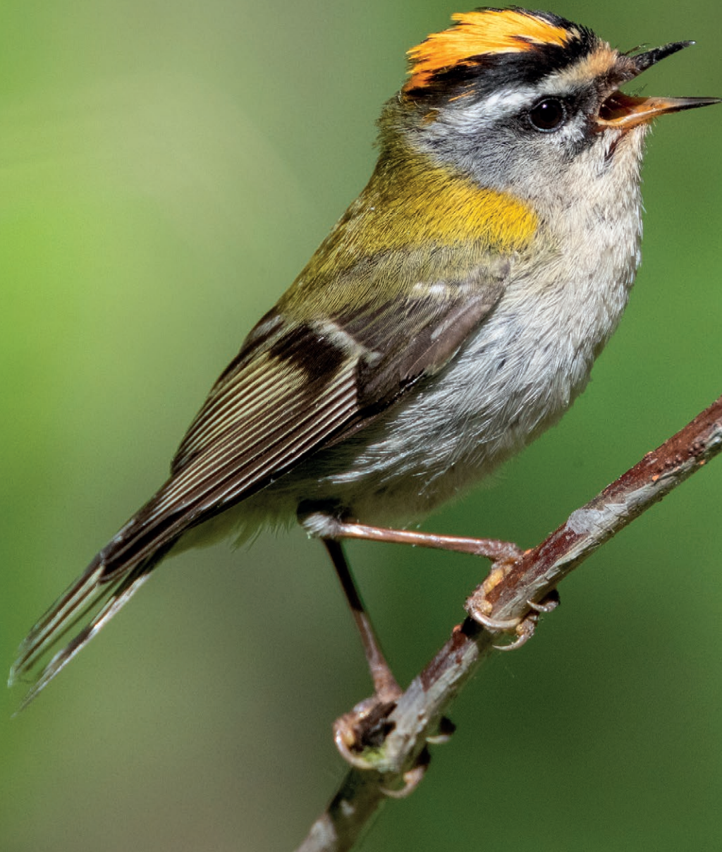
Laulava tulipäähippiäiskoiras esittelee päälään oranssia väriä usein tarkoituksella, jolloin se on helposti havaittavissa. Helsinki 15.6.2017.