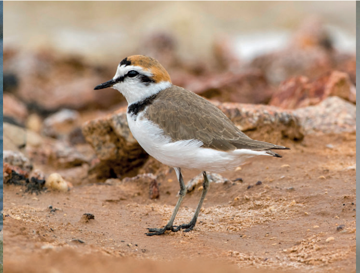
Mustajalkatyllikoiraalla on juhlapuvussa punaruskea niska ja päälaki. Otsassa, korvanpeitinhöyhenissä ja rinnan sivuilla on pitkulaiset mustat täplät. Nuorilla koirilla kuviot voivat olla himmeämmät. Eilat, Israel 28.3.2016.