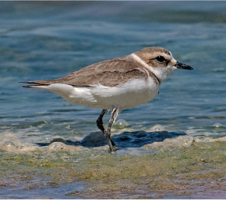
Mustajalkatyllinaaras on yleisväriykseltään hyvin vaalea. Huomaa yhtenäinen valkea niskavyö sekä heikko lämmin sävy silmäkulmajuovassa ja niskassa. Laji on tylliin verrattuna pitkäjäalkainen, sironokkainen ja isopäinen. Eilat, Israel, 18.3.2018.