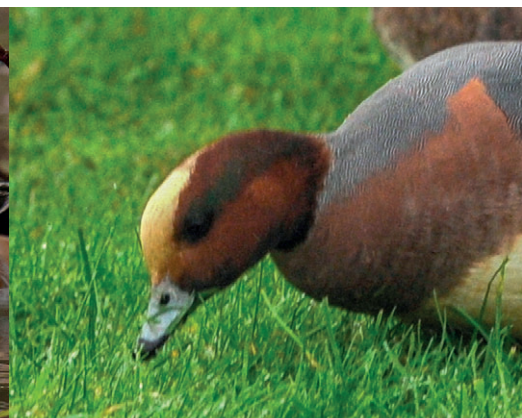
Patagonianhaapanan tuntomerkkejä ovat laaja valkea laikku nokan tyvellä ja otsassa, silmän takana oleva vihertävä alue, laajalti tummat hartiahöyhenten keskustat, laajalti valkeat ylä- ja alaperä sekä oranssit kupeet. Slimbridge, Iso-Britannia, 7.5.2006.

Nykykäsityksen mukaan vihertävä väri silmän takana kuuluu haapanan normaaliin lajinsisäiseen vaihteluun, mutta se voi myös olla merkki jostain kaukaisesta risteytymisestä jonkun vihreäpäisen sorsalajin kanssa. Tällä haapanalla ei ole mitään muuta mahdolliseen risteymään viittaavaa tuntomerkkiä. Norfolk, Iso-Britannia, 31.1.2016.