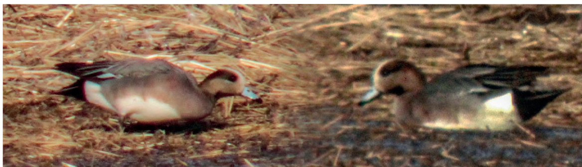
Amerikanhaapanan ja haapanan risteymä voi muistuttaa ensi näkemältä paljon amerikanhaapanaa. Tämän linnun selkä ja kupeiden takaosa on kuitenkin haapanamaisesti harmaa. Silmän takan oleva tumma juova ei ole säihkyvän vihreä. Linnun kainalohöyhenet, jotka eivät näy kuvissa, olivat tavallisen haapanan tapaan harmahtavat. Vihti, 22.4.2012.

Amerikan- tai patagonianhaapanaristeymäksi määrittäminen ei voi perustua pelkästään vihreään juovaan päässä, vaan määrittäminen pitää perustua useaan tuntomerkkiin. Päänku-