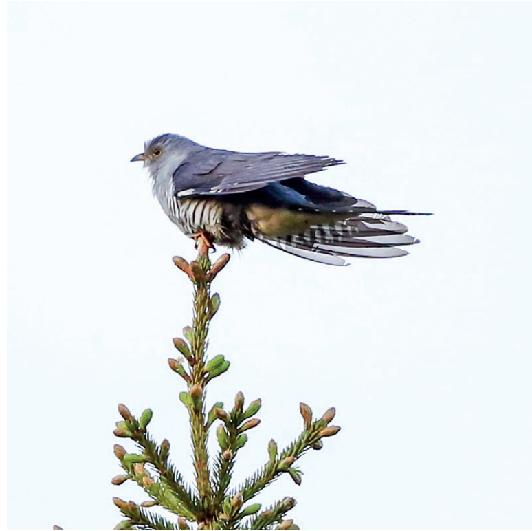
Idänkäellä kupeiden raidoitus on yleensä harvempi kuin käellä ja alaperässä on laajalti beesiiä sävyä. Selkäpuoli on vähän tummempi kuin käellä. Sotkamo 16.6.2015