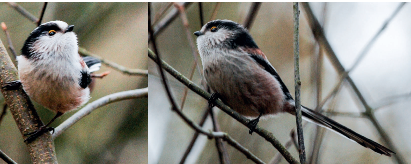
Klassisella europaeuksella on yhtenäisen musta leveä juova nokan tyvestä niskaan asti, viirutusta poskilla ja pään sivuilla sekä viiruista muodostunut rintavyö. Etenkin vasemmanpuoleisella linnulla on hyvin punertava, jopa oranssiin vivahtava vatsapuoli. Alankomaat 24.11.2014.

nimialalajin linnuista 66 prosentilla oli leveä vaalea reunus keskimmaisissa ja 26 prosentilla sisimmässä tertiaalissa. Europaeuksella vastaavat osuudet olivat 10 ja 1 prosenttia. Pelkästään Hangon lintuaseman pienessä aineistossa tertiaalien kuvio vaihtelee voimakkaasti, eikä tuntomerkistä ole kuin suuntaa-antavaa apua määrittämisen tueksi.