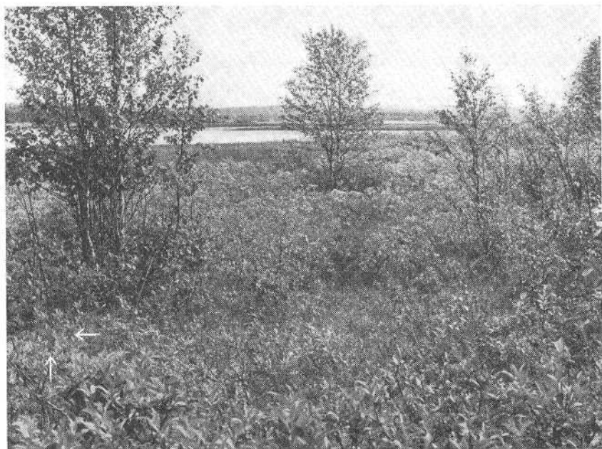
Bild 2. Die Nistbiotop der Zwergammer in Kuusamo. Pfeile: der Platz des Nestes.

Singstelle entfernt und ging danach wenigstens einmal am Tage zum Nest. An mehreren Tagen half ihm dabei Herr Risto Lounema. Dieses Material sowie das über das Vorkommen der Zwergammer in Finnland nach 1957 stellte zusammen und behandelte K. M. Im ersten Teil dieses Artikels werden die beim obengenannten Nest gewonnenen Erkenntnisse von der Nistbiologie der Art mitgeteilt.